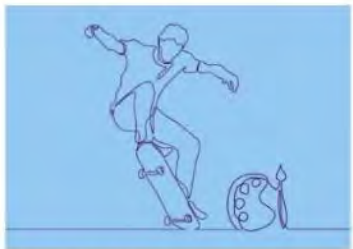
Sport en cultuur