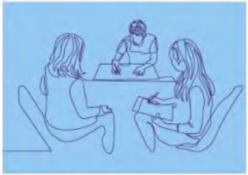
Mentoring en coaching